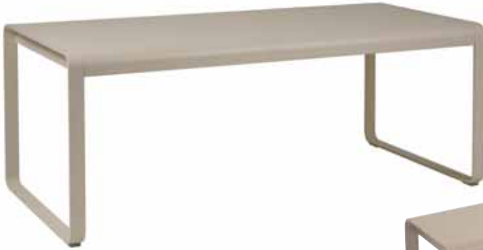
8420 Knockdown table Tisch, demontierbar

Registered trademark Exklusives patentiertes Modell