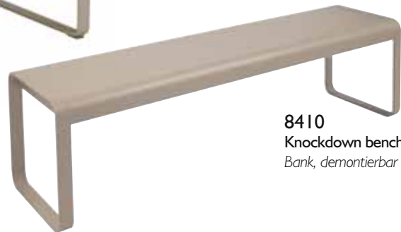
8410 Knockdown bench Bank, demontierbar