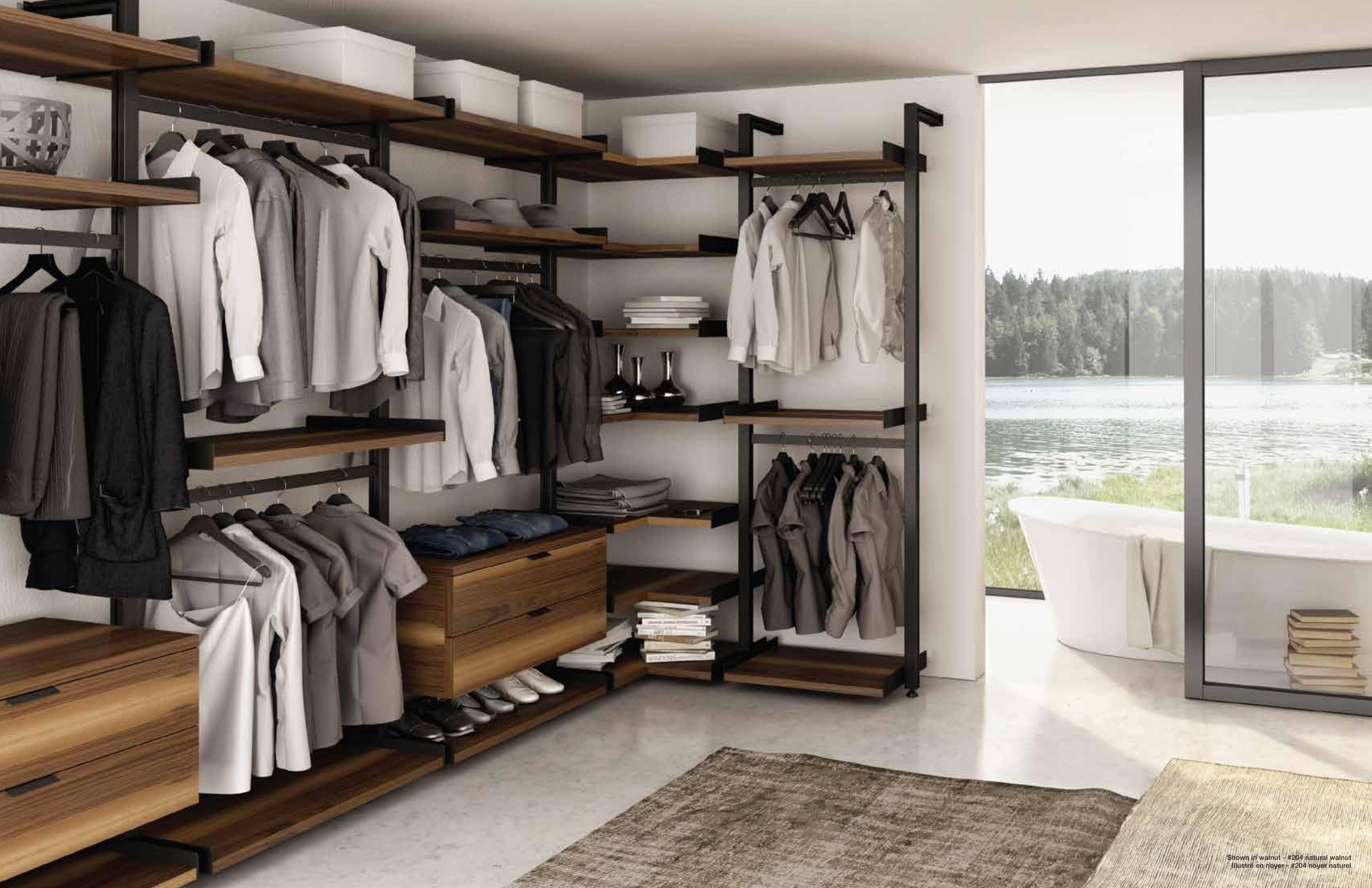
Shown in walnut - #204 natural walnut Illustré en noyer - #204 noyer naturel