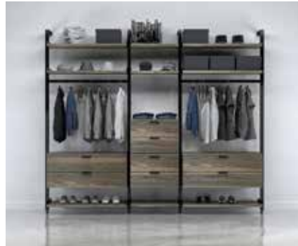
G-8 SECTION: 40" + 24" + 40" TOTAL: W 111" x D 21" x H 92"