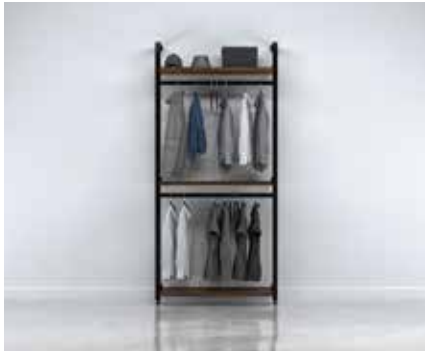
G-1 SECTION: 40" TOTAL: W 43½" x D 21" x H 92"