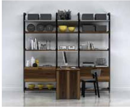
G-6 SECTION: 36" + 24" + 36" TOTAL: W 103" x D 60" x H 92"