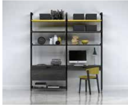
G-5 SECTION: 36" + 36" TOTAL: W 77¼" x D 21" x H 92"