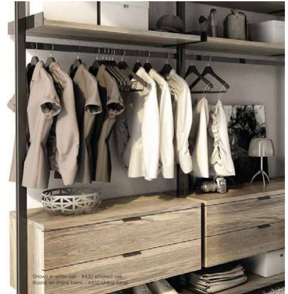
Shown in white oak - #432 smoked oak Illustré en chêne blanc - #432 chêne fumé

THE GRAVITY COLLECTION IS PART OF THE UP LINE BY HUPPÉ. MADE WITH 100% DOMESTIC MATERIALS, IT FEATURES CLEAN LINES, SIMPLE FUNCTIONALITY, AND A SOPHISTICATED LOOK. AT THE HEART OF GRAVITY IS THE FRAMING, WHICH CAN BE CUSTOM-BUILT AS A COMPLEX STRUCTURE TO FILL A LARGE SPACE OR A BASIC ONE TO FIT A TIGHT AREA IN A LOFT.