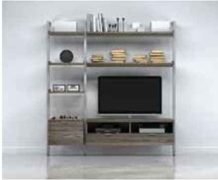
G-4 SECTION: 24" + 60" TOTAL: W 89¼" x D 21" x H 92"