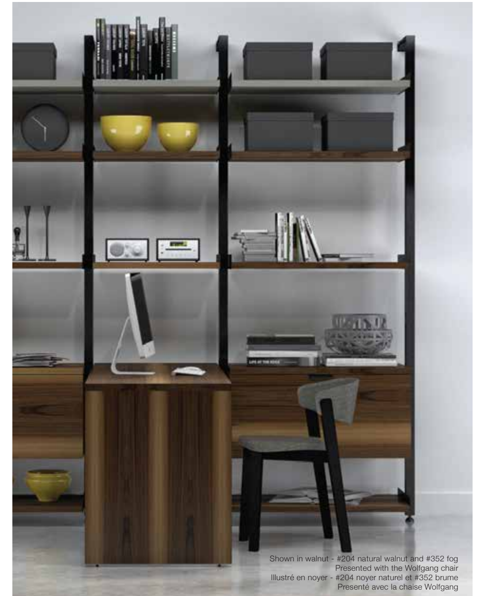
Shown in walnut - #204 natural walnut and #352 fog Presented with the Wolfgang chair Illustré en noyer - #204 noyer naturel et #352 brume Présenté avec la chaise Wolfgang

DESIGNED BY JOEL DUPRAS, GRAVITY IS A FULLY CUSTOMIZABLE WALK-IN CLOSET ORGANIZER, LOFT WARDROBE SYSTEM, MEDIA CENTRE, WORK ENVIRONMENT, OR SIMPLY A STORAGE SOLUTION SUITED TO THE REQUIREMENTS OF ANY SPACE.