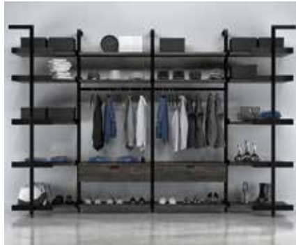
G-9 SECTION: 30" + 36" + 36" + 30" TOTAL: W 141½" x D 33" x H 92"

THE DRAWERS AND SHELVING ARE FULLY ADJUSTABLE WITHIN THE ALUMINUM FRAME, AS THE INTERNAL SUPPORT BRACKETS SLIDE FREELY FROM TOP TO BOTTOM. ALL DRAWERS ARE EQUIPPED WITH BOTTOM-MOUNTED BALL BEARING SOFT-CLOSE GLIDES AND SILK HAND-FINISHED INTERIORS. THE ALUMINUM FRAMING IS AVAILABLE IN A NATURAL ANODIZED FINISH AND BLACK ANODIZED FINISH. MULTIPLE STAIN COLOURS ARE AVAILABLE FOR EACH WOOD SPECIES.