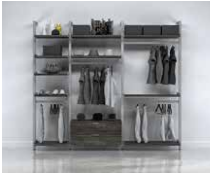
G-7 SECTION: 24" + 36" + 40" TOTAL: W 107" x D 21" x H 92"