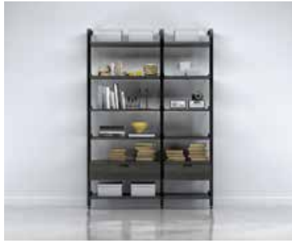
G-3 SECTION: 36" + 24" TOTAL: W 65¼" x D 21" x H 92"