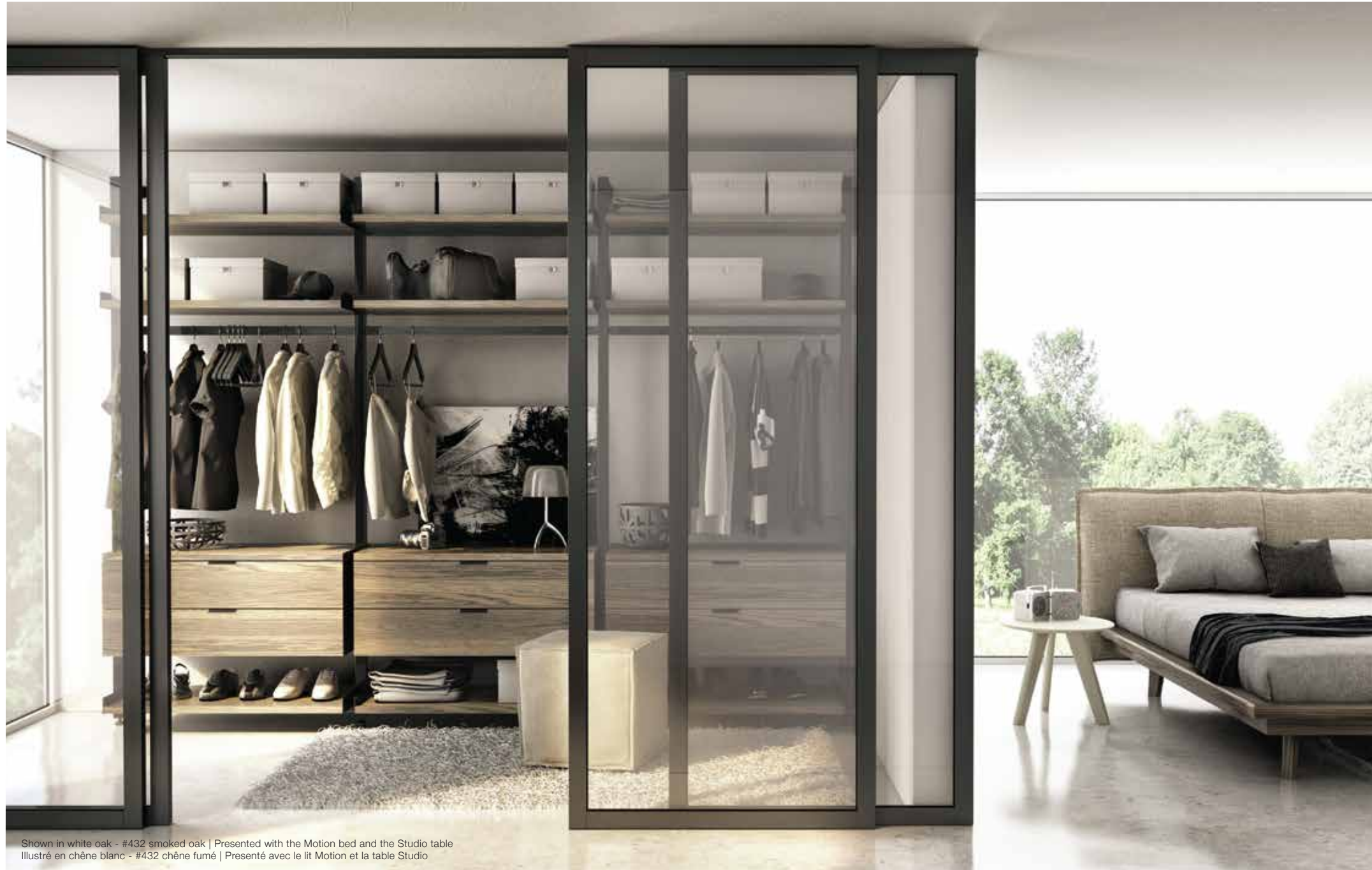
Shown in white oak - #432 smoked oak | Presented with the Motion bed and the Studio table Illustré en chêne blanc - #432 chêne fumé | Présenté avec le lit Motion et la table Studio