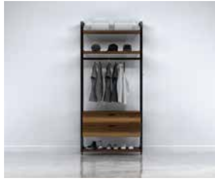
G-2 SECTION: 40" TOTAL: W 43½" x D 21" x H 92"