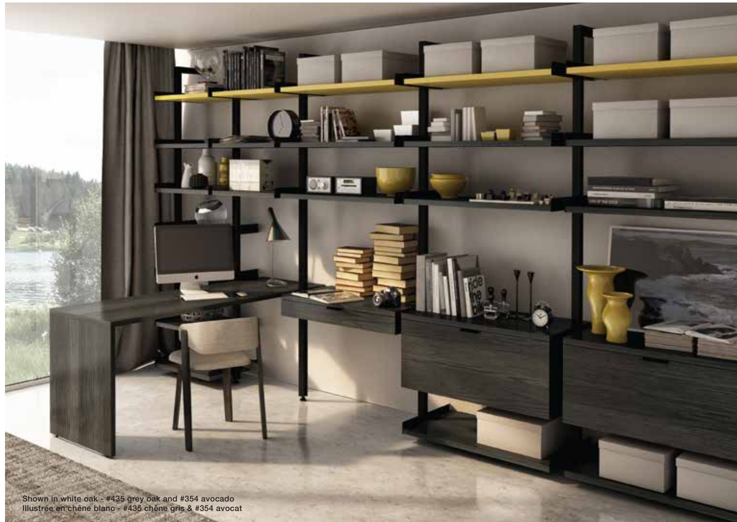
Shown in white oak - #435 grey oak and #354 avocado Illustrée en chêne blanc - #435 chêne gris & #354 avocat

Conçu par Joel Dupras, Gravity se veut un organisateur de walk-in, un système de rangement pour le placard d'un loft, un meuble audio-vidéo, un espace de travail ou tout simplement une solution adaptée aux besoins de n'importe quel espace.