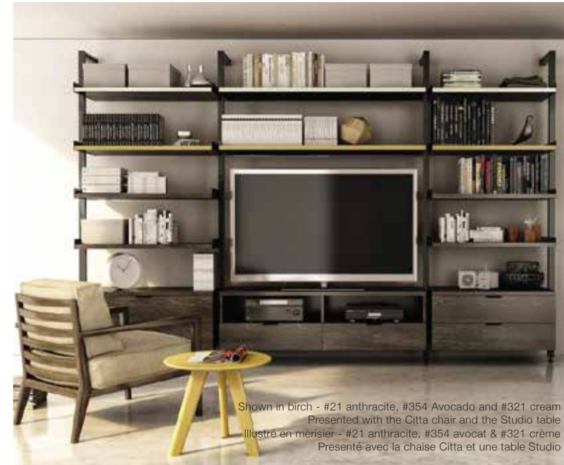
Shown in birch - #21 anthracite, #354 Avocado and #321 cream Presented with the Citta chair and the Studio table Illustré en merisier - #21 anthracite, #354 avocat & #321 crème Présenté avec la chaise Citta et une table Studio