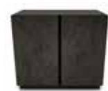
6629 SECTION PORTE DOOR SECTION L/W 30" X P/D 19" X H 26 1/2"