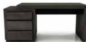
6602-1002R BUREAU DESK L/W 54-72" X P/D 26" X H 29"

LA COLLECTION CASTELLA DE LA GAMME HUPPÉ OFFRE UN VASTE ÉVENTAIL DE MEUBLES DE BUREAU EN PLACAGE DE MERISIER QUI S'AGENCENT ENTRE EUX EN DIFFÉRENTES CONFIGURATIONS AFIN D'OFFRIR UN AMÉNAGEMENT PERSONNALISÉ POUR L'ESPACE-TRAVAIL. IL NE SUFFIT QUE DE MÉLANGER ET COMBINER LES MORCEAUX AU GRÉ DE SA CRÉATIVITÉ POUR OBTENIR UN DÉCOR QUI EST À LA FOIS UNIQUE ET FONCTIONNEL.