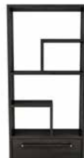
7705 ÉTAGÈRE BOOKCASE L/W 36" X P/D 11 1/2" X H 72"